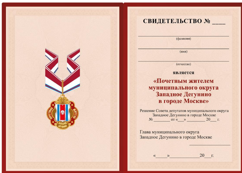
Внутренняя сторона Размер свидетельства 210×150 мм