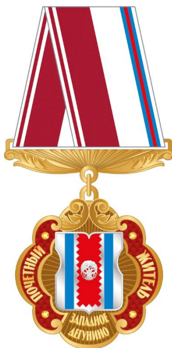
Рисунок ленты знака к почетному званию муниципального округа Западное Дегунино в городе Москве "Почетный житель муниципального округа Западное Дегунино в городе Москве" в виде розетки

Рисунок знака к почетному званию муниципального округа Западное Дегунино в городе Москве "Почетный житель муниципального округа Западное Дегунино в городе Москве" (на трапециевидной колодке)