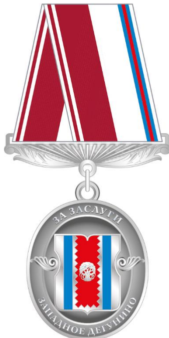
Рисунок знака отличия муниципального округа Западное Дегунино в городе Москве "За заслуги"

Приложение 7 к решению Совета депутатов муниципального округа Западное Дегунино от «29» мая 2024 года № 6/33