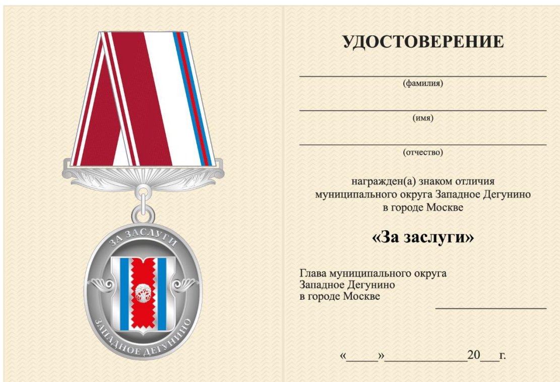
Внутренняя сторона Размер удостоверения 145×105 мм