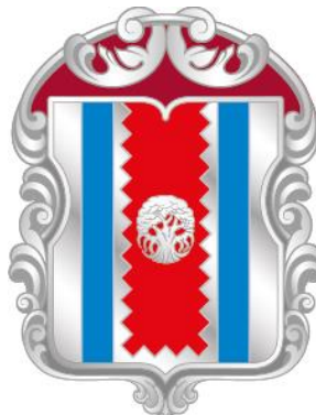
Рисунок нагрудного знака к Благодарности муниципального округа Западное Дегунино в городе Москве