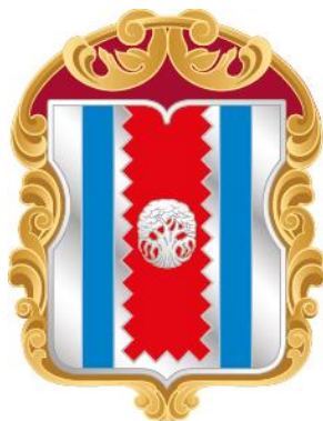
Рисунок нагрудного знака к Почетной грамоте муниципального округа Западное Дегунино в городе Москве

Приложение 10 к решению Совета депутатов муниципального округа Западное Дегунино от «29» мая 2024 года № 6/33