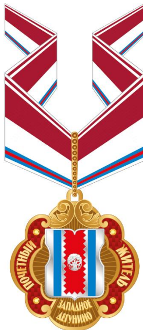
Рисунок знака к почетному званию муниципального округа Западное Дегунино в городе Москве "Почетный житель муниципального округа Западное Дегунино в городе Москве" (на шейной ленте)